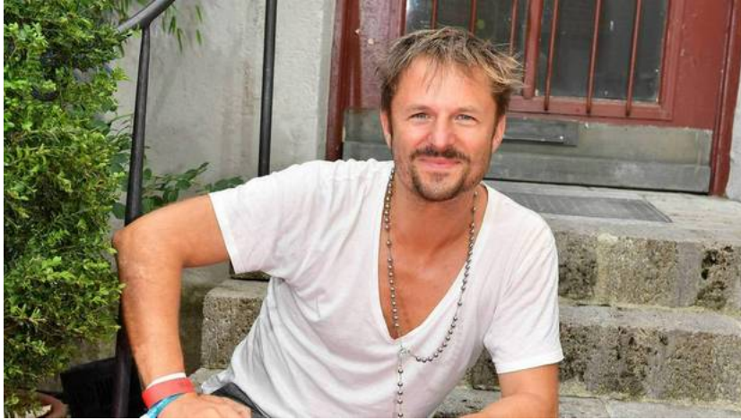
Schauspieler Philipp Hochmair beim Filmfest München

Philipp Hochmair ist in einer neuen fiesen Rolle im Kino zu sehen. Die Dreharbeiten für "Candelaria" auf Kuba waren alles andere als normal.